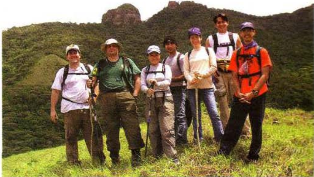
En una sencilla caminata se pueden descubrir muchos datos sobre la flora, fauna e historia de Panamá.

Lo cierto es que muchos años atrás Panamá era ruta de tránsito para indígenas de diferentes procedencias. Desde entonces estos senderos se han estado utilizando. No podemos olvidar algunas otras rutas que tienen una fuerte carga histórica. El Camino de Cruces no es más que un sendero que durante tiempos de la colonia unía las poblaciones del Caribe con la ciudad de Panamá en el Pacífico. Algunos historiadores y aventureros han establecido otras rutas, por ejemplo, la que supuestamente seguiría Vasco Núñez de Balboa en la búsqueda del llamado Mar del Sur, o la que utilizaría Victoriano Lorenzo para movilizar sus tropas desde