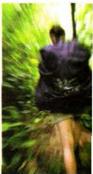
Un excursionista no es solo un turista. Es una persona que cuida la naturaleza