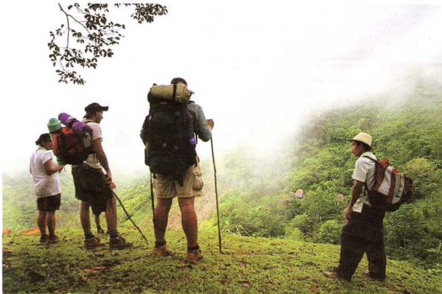
Miembros del Club de Excursionistas del Istmo en el Sendero Victoriano.