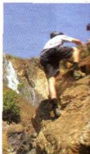
El senderismo también genera amistad entre conocidos y extraños

De acuerdo con Esquivel, "cuando la gente empieza a amar el esfuerzo de tantas asociaciones conservacionistas en Panamá es que se verán los resultados". ■